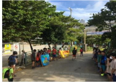
正門 横断幕を広げ 心のもったあいさつ

掃除は何のためにやるの？自分たちの過ごす大切な場所だから。一人でやるより、仲間と一緒にやると大変だけど・・・気持ちいい。「ありがとう」って言われて、みんなから認められているような気持ちになる。自分ってみんなのためになっているんだ。みんなから頼られているんだと思うと嬉しくなってくる。一人一人がやるべきことを協力しながら取り組んでいました（下写真）。