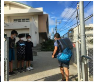
裏門 元気につながる笑顔のあいさつ