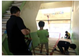
4年生と先生、雑巾で階段がピカピカに！

6月15日(月)からあいさつ運動がスタートしました。初日は5年1組さんが児童会・生活委員会の6年生と一緒にいきました。正門でも裏門でも「〇〇さん、おはよう。今日も安全で楽しい一日にしていましょう」元気が湧いてくる素敵なあいさつが響いていました。