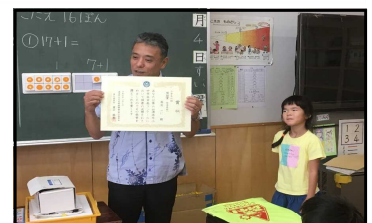
みんなから祝福の拍手！