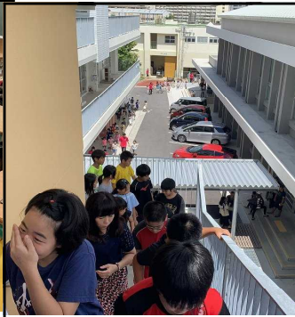
②非常階段も使い4階へ