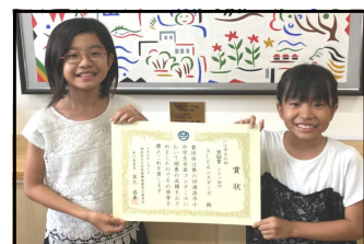
ぎしとみシスターズ