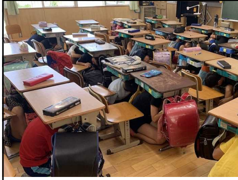
①まずは机の下に避難