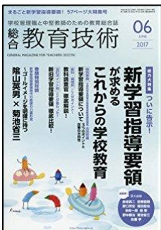
『総合教育技術』 (小学館)

総力大特集：新学習指導要領が求めるこれからの学校教育 第1部：教科・領域別 教科調査官徹底解説！ 第2部：改訂ポイント別 新旧学習指導要領 徹底比較！