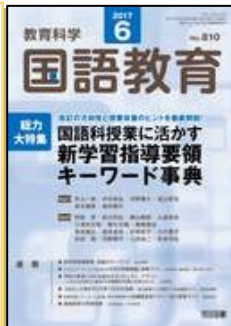
『教育科学/国語教育』(明治図書)

総力大特集：新学習指導要領が求めるこれからの学校教育 第1部：教科・領域別 教科調査官徹底解説！ 第2部：改訂ポイント別 新旧学習指導要領 徹底比較！