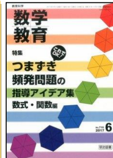
『教育科学/数学教育』(明治図書)

総力大特集：国語科授業に活かす新学習指導要領キーワード辞典 1. 答申・学習指導要領を読み解く！新しい国語科の授業づくり 2. キーワードからみる改訂のポイントと授業づくり