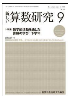
『新しい算数研究』 (東洋館出版社)

特集：「深い学び」を実現する国語授業づくり 考えの形成・深化を促す「書くこと」の指導の工夫 第 2 特集：全国学力・学習状況調査を生かした資質・能力を育む授業づくり