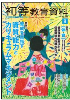
『初等教育資料』 (東洋館出版社)

特集 1. 育成を目指す資質・能力とカリキュラム・マネジメント 特集 2. 「体育」新学習指導要領に向けた指導の在り方 健康課題を解決する保健領域の指導の在り方