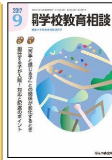
『月刊学校教育相談』 (ほんの森出版)

総力大特集：新学習指導要領が求める「主体的・対話的で深い」授業の具体像 特集 2. 夏休み明けの荒れを防ぐ生活指導・SNS指導 特集 3. 部活指導改革がもたらす学校の未来