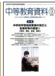
『中等教育資料』 (学事出版)

特集：必ずうまくいく学級リスタート術－夏休み明け、学級経営の達人はここを見る！ 4つの観点で「目のつけどころ」を伝授 ○1 学期よりもワンランク上を目指せ！学級アップグレード大作戦