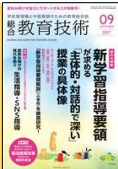
『総合教育技術』 (小学館)

特集 1. 育成を目指す資質・能力とカリキュラム・マネジメント 特集 2. 「体育」新学習指導要領に向けた指導の在り方 健康課題を解決する保健領域の指導の在り方