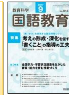
『教育科学 国語教育』(明治図書)

特集：中学校学習指導要領の改訂と各教科等の展望② <数学、理科、音楽、美術>一教科調査官による解説、大学教授等による論説、及び中学校での実践研究 連載：各教科等の改善/充実の視点