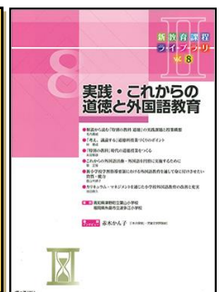
『新教育課程ライブラリⅡ』(ぎょうせい)