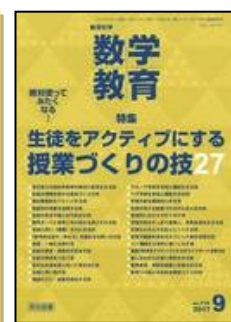
『教育科学 数学教育』(明治図書)

特集：数学的活動を通じた算数の学び：下学年 論説 1. 下学年の数学的活動 論説 2. 楽しく魅力ある数学的活動を 研究事例：4本 その他連載多数