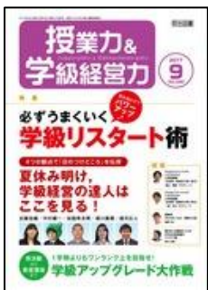
『授業力&学級経営力』(明治図書)

特集 1. 「苦手と感じる子」との関係が変化するとき 特集 2: 担任する子が入院！対応と配慮のポイント <連載> 【保護者をクレーマーにしないために】 ほか