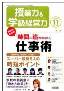
『授業力&学級経営力』(明治図書)

特集 1：子どもの「やる気」を引き出す小さな工夫 特集 2：私の 10秒・30秒・3分 カウンセリング <リレー連載> 【菅野純の教育相談「夜の学校」発達障害のある子に向き合う先生の駆け込み寺】 ほか