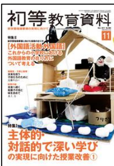
『初等教育資料』 (東洋館出版社)

特集 1.主体的・対話的で深い学びの実現に向けた授業改善① 特集 2.「外国語活動・外国語」 これからの小学校における外国語教育の在り方について考える