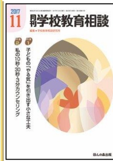
『月刊学校教育相談』 (ほんの森出版)

総力大特集：どう進める？新学習指導要領「教科横断的な学び」と「カリキュラム・マネジメント」 特集 2：評価方法と文例を徹底研究 ここがポイント！ 「特別の教科 道徳」の「評価」