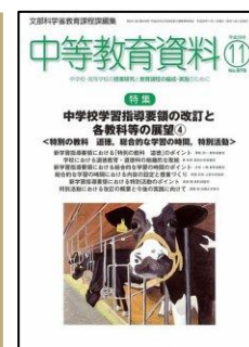
『中等教育資料』 (学事出版)

特集：教師のための「時間に追われない」仕事術 スーパー教師 5人の時短ポイント <特別寄稿> 学校の職員室に「働き方改革」を！労務管理なき長時間労働を見える化する