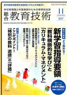
『総合教育技術』 (小学館)

特集 1.主体的・対話的で深い学びの実現に向けた授業改善① 特集 2.「外国語活動・外国語」 これからの小学校における外国語教育の在り方について考える