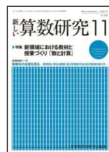
『新しい算数研究』 (東洋館出版社)

特集：育成をめざす資質・能力を踏まえた「思考力、判断力、表現力等」を育てる授業 小特集：主体的・対話的で深い学びをめざす！夏期集会&研究会レポート