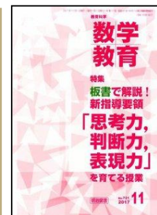
『教育科学 数学教育』(明治図書)

特集：新領域における教材と授業づくり「数と計算」 論説 1. 新領域における教材と授業づくり—数学的な見方・考え方をどうとらえるか ほか 研究事例等