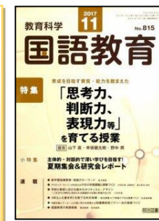
『教育科学 国語教育』(明治図書)

特集：中学校学習指導要領の改訂と各教科等の展望④ <特別の教科 道徳, 総合的な学習の時間, 特別活動> ※教科調査官による解説、大学教授等による論説、及び中学校での実践研究