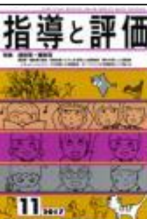
『指導と評価』 (図書文化)