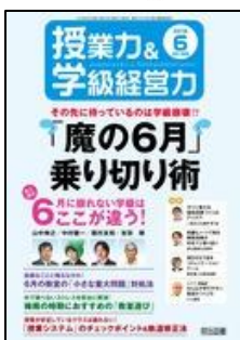
『授業力 & 学級経営力』(明治図書)

定期購読雑誌3タイトルの特集記事についてご紹介します。(2面にも雑誌紹介。) ※最新号以外のバックナンバーは貸出ししています。どうぞご利用下さい。