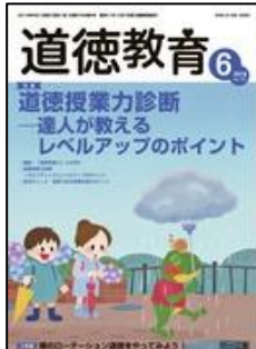
『道徳教育』(明治図書)

特集: その先に待っているのは学級崩壊!? 「魔の6月」乗り切り術 ■些細なことと毎ることなかれ! 6月の教室の「小さな大問題」対処法 ■「授業システム」のチェックポイント & 軌道修正法ほか