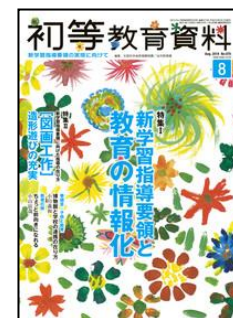
『月刊 学校教育相談』（ほんの森出版）

特集: ペア学習&グループ学習パーフェクトガイド ＜連載＞ ●新学習指導要領と中学校数学科の授業づくり⑤ ●板書でみる 1時間の授業改善のポイント⑤ ●生徒の心をつかむお笑い数学ネタ 他