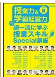
『授業力&学級経営力』（明治図書）

特集 高等学校学習指導要領の改訂と各教科等の展望② ＜地理歴史・公民・保健体育＞ （解説）新学習指導要領における地理歴史科のポイント （論説）高等学校学習指導要領の改訂と地理歴史科のポイント ほか