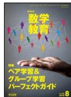
『教育科学 数学教育』（明治図書）

年間共通テーマ 数学的に考える資質・能力を育成する授業の在り方 特集1 「数学的な見方・考え方」で授業を変える 小学年 特集2 新学習指導要領が目指す授業へ！＜これからの授業＞を描く