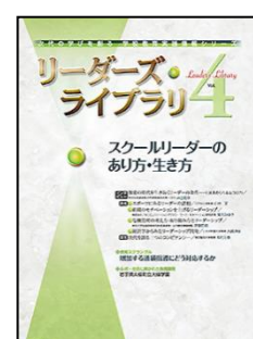
『リーダーズ・ライブラリ』（ぎょうせい）

年間テーマ 未来へつなぐ 幼児教育の本質 特集 (8月): 「社会生活との関わり」 ★論説「幼児が社会生活との関わりを深めるとは」 ★事例「家庭と園のつながりを大切に活動を通して」 ※表紙は4月号。