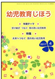
『幼児教育じほう』（全国国公立幼稚園・こども園長会）

特集 I 新学習指導要領と教育の情報化 第1部: ICTを活用した教育の充実 第2部: プログラミング教育の実施に向けて 特集 II: 図画工作 造形遊びの充実 ほか