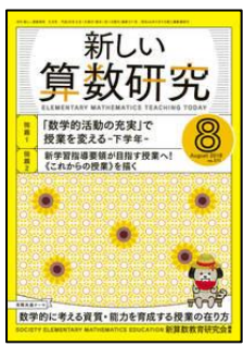
『新しい算数研究』（東洋館出版社）

特集: 1号まるごと！超一流に学ぶ授業スキルアップ Special 講座 【連載】 ●クラスがまとまる！笑顔が広がる！今月の学級経営ネタ⑤ ほか