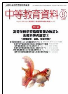
『中等教育資料』（図書文化）

特集 一流教師がやっている国語科・教材研究の極意 小・中学校の教材研究と授業アイデア ＜連載＞●思考力を育てる！深い学びを導く課題と発問 『ちいちゃんのかげおくり』（小3）『おくのぼそ道』（中3）他