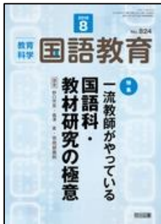
『教育科学 国語教育』（明治図書）

特集 一流教師がやっている国語科・教材研究の極意 小・中学校の教材研究と授業アイデア ＜連載＞●思考力を育てる！深い学びを導く課題と発問 『ちいちゃんのかげおくり』（小3）『おくのぼそ道』（中3）他