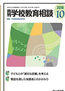
『月刊学校教育相談』(ほんの森出版)

★つまずきの原因分析とピンポイント指導ガイド ＜連載＞●生徒の心をつかむ お笑い数学ネタ 他