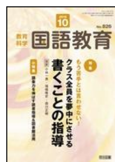
『教育科学/国語教育』(明治図書)

(解説) 新学習指導要領における芸術科(音楽)のポイント (論説) 高等学校学習指導要領改訂と芸術科(音楽)の展望