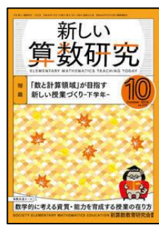
『新しい算数研究』 (東洋館出版社)