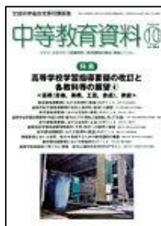
『中等教育資料』 (図書文化)

特集：高等学校学習指導要領の改訂と各教科等の展望 ④＜芸術(音楽、美術、工芸、書道)、家庭＞