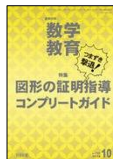
『教育科学 数学教育』(明治図書)

特集：つまずき撃退！図形の証明指導コンプリートガイド ★つまずきを生じさせない指導のアイデア