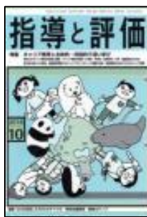
『指導と評価』 (図書文化)

＜連載＞●木陰の物語ー深夜の祈禱 ●ポジティブ心理学で学校づくりー折れない心の処方箋 その7 他