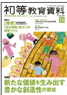
『初等教育資料』 (東洋館出版社)