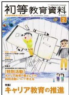
『初等教育資料』 (東洋館出版社)

定期購読雑誌3タイトルの特集記事についてご紹介します。(2面にも雑誌紹介。) ※最新号以外は貸出ししています。どうぞお気軽にご利用下さい。