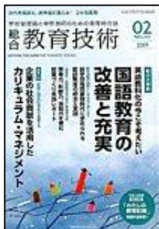
『総合教育技術』 (小学館)

特集Ⅰ: キャリア教育の推進 ＜論説＞子供の発達を支えるキャリア教育の展開 特集Ⅱ: 特別活動 キャリア教育の要としての特別活動について考える 【連載】特別支援教育・幼児教育の論説及び実践事例ほか