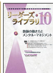
『リーダーズ・ライブラリ』（ぎょうせい）

特集：「気になる子」が輝く学級 ◆「気になる子」のよさを見つけるアセスメント ◆強みを活かしたLDの支援 ◆ADHD、ASDの特性をプラスに活かす学級経営 ほか その他【連載】多数