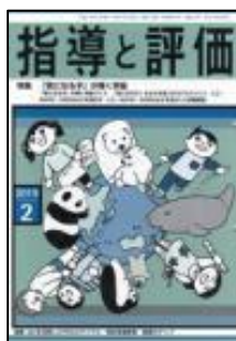
『指導と評価』（図書文化）

特集：言葉の力がグングン伸びる！語彙力を高める指導術&授業づくりのアイデア ＜提言＞国語科授業づくりにおける語彙指導 第2特集：これならできる！国語科授業でICT活用 ほか