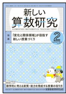
『新しい算数研究』（東洋館出版社）

特集：有名教材で比較検討！「判断力」「心情」「態度」別指導案ガイド ○徹底開設/道徳的判断力・道徳的心情・道徳的实践意欲と態度 ○比較検討「判断力」「心情」「態度」別指導案ガイド ほか