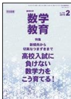
『教育科学/数学教育』（明治図書）

特集：「変化と関係領域」が目指す新しい授業づくり 【論説】1 内容の概観として整理された三つの内容をどのように捉えるか ほか 【研究事例】1 伴って変わる二つの数量の変化や対応の特徴を考察すること ほか