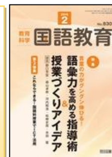
『教育科学 国語教育』（明治図書）

特集：新傾向から切実なつまづきまで高校入試に負けない数学力をこう育てる！ ○問題の長文化、複雑化への対応-読解力を高める指導の工夫 ほか 【連載】●板書でみる1時間の授業改善のポイント① ほか