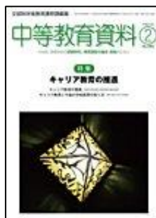
『中等教育資料』（図書文化）

特集：永久保存版 毎日使える！必ず役立つ！授業のネタ Special ●超一流は「勝負授業」のネタをこう仕込む ●授業がもっと知的に！教科書+αで使える「深い&面白い」話 【連載】すぐに使える国語授業づくりのアイデアほか