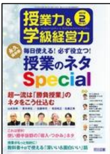
『授業力&学級経営力』（明治図書）

特集：永久保存版 毎日使える！必ず役立つ！授業のネタ Special ●超一流は「勝負授業」のネタをこう仕込む ●授業がもっと知的に！教科書+αで使える「深い&面白い」話 【連載】すぐに使える国語授業づくりのアイデアほか