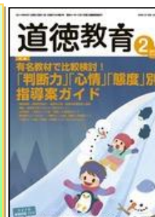
『道徳教育』（明治図書）

特集：キャリア教育の推進 (論説)キャリア教育と今後の学校教育の在り方 (実践研究)小中高連携による発達段階に応じたキャリア教育の充実 ◆連載 各教科等の改善/充実の視点-各教科調査官 ほか