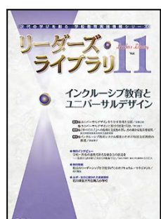
『リーダーズ・ライブラリ』(ぎょうせい)

特集: カリキュラム・マネジメントの実践 ◆カリキュラム・マネジメントと管理職のリーダーシップ ◆学校力・教師力を向上させるカリキュラム・マネジメント <新連載> 続・説明文・意見文を書くことの指導 (1) ほか