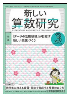
『新しい算数研究』 (東洋館出版社)

特集1: 異動したときの心構え、異動してきた先生への接し方 特集2: 子どもの成長を次年度に引き継ぐ 【連載】●ポジティブ心理学で学校づくり「折れない心の処方箋」 ●木陰の物語「語り方」ほか