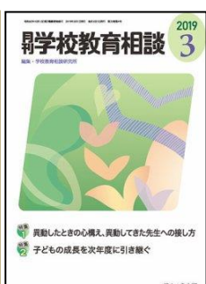
『月刊学校教育相談』 (ほんの森出版)

特集: 現代的な諸課題に対応する教科等横断的な学習 (論説) 現代的な諸課題に対応する資質・能力を育む教科等横断的な学びの実現 <連載> ●各教科等の改善/充実の視点-各教科調査官 ほか