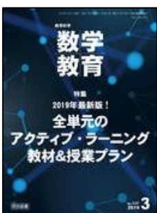
『教育科学/数学教育』(明治図書)

特集: 「変化と関係領域」を目指す新しい授業づくり 【論説】1 これからの統計教育は子ども達にどんな資質・能力を育成するのか 【研究事例】1 どのように統計教育の最初の学びを描くか ◆H30 年度新算数教育研究会湯河原セミナー大会集録 他