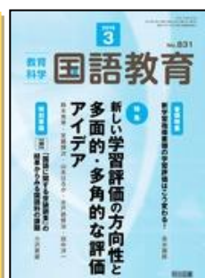
『教育科学 国語教育』(明治図書)

特集: 2019 年最新版! 全単元のアクティブ・ラーニング教材&授業プラン <連載> ●数学科の授業における記述の指導 ●ICTを活用した「主体的・対話的で深い学び」-GICを使った学び合いの授業のキーワードとしての「大発見」