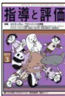
『指導と評価』 (図書文化)

巻頭特集: 新学習指導要領の学習評価はこう変わる! 国語科学習評価 改訂のポイント 特集: 新しい学習評価の方向性と多面的・多角的な評価アイデア <連載> 思考力を育てる! 深い学びを導く課題と発問ほか