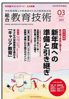
『総合教育技術』 (小学館)

総力大特集: 移行期2年目に備える! 新年度への準備と引き継ぎ 特集2: 子どもの学習意欲を高める「キャリア教育」 <連載> ●学びの共同体の創造 ●半径 3m からの「働き方改革」 ●菊地省三の学級づくり方程式ほか