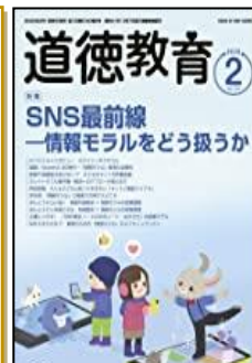
『道徳教育』 （明治図書）

特集： 教師はしゃべることが仕事だから「話す」を極める ●“深い学び”の力ギ！「問い返し」発問上達法 ほか 【連載】「主体的・対話的で深い学び」への授業改善連載第11回「対話的な学び」の本質を捉えた授業設計の大切さ&学び続ける教師であるために