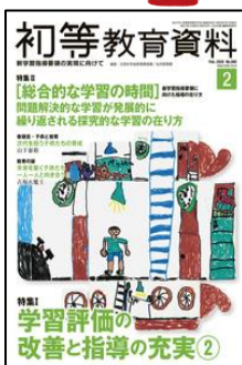
『初等教育資料』 （東洋館出版社）

定期購読雑誌10タイトルの特集記事についてご紹介します。（2面にも雑誌紹介） ※最新号以外は貸出ししています。どうぞお気軽にご利用下さい。