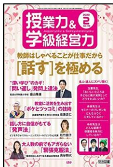
『授業力&学級経営力』 （明治図書）

特集Ⅰ： 学習評価の改善と指導の充実② 特集Ⅱ： 『総合的な学習の時間』問題解決的な学習が発展的に繰り返される探求的な学習の在り方 巻頭言・子供と教育： 次代を担う子供たちの育成