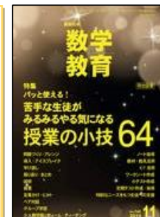
『数学教育』 （明治図書）

特集1：全面实施に向けて、今、やらなければならないこと （誌上授業研究会） —数学的活動— 特集2：提案と討議の異種の二つの量の割合の導入～「混み具合」から「速さ」からか～