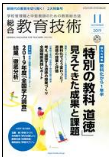
『総合教育技術』 （小学館）

総力大特集 教科化から1年半 「特別の教科 道徳」見えてきた成果と課題 特集Ⅱ 傾向と課題&注目自治体レポート2019年度「全国学力調査」結果徹底分析 ●学校リーダーのための間違えないICT(実践編)