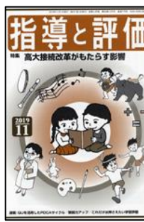
『指導と評価』 （図書文化）

総力大特集：理論×実践で追求する国語の「深い学び」 小特集：授業の腕を上げる！夏期集会&研究会報告 ●学び合いがうまくいく！教科書教材のペア&グループ学習（第8回）