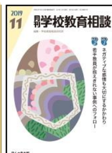
『月刊学校教育相談』 （ほんの森出版）

特集：「主体的・対話的で深い学び」の実現に向けた学習指導の工夫改善②（理科、理数、芸術（音楽、美術、工芸、書道）） ●学校文化を創るふるさとに誇りをもち世界へはばたくらぶの子/沖縄県宮古島市立伊良部島小・中学校