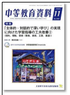
『中等教育資料』 （学事出版）

総力大特集 教科化から1年半 「特別の教科 道徳」見えてきた成果と課題 特集Ⅱ 傾向と課題&注目自治体レポート2019年度「全国学力調査」結果徹底分析 ●学校リーダーのための間違えないICT(実践編)