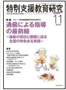
『特別支援教育研究』 （東洋館出版社）

特集：高大接続改革がもたらす影響 ＜連載＞QUを活用したPDC Aサイクルで教育実践の向上を目指して(8)新学習指導要領における幼小小連携の取組(2)—生活力を育成する保育園の確実な実践