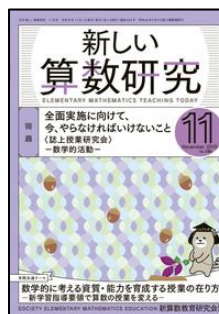
『新しい算数研究』 （東洋館出版社）

特集1：ネガティブな感情も大切にできるかかわり 特集2：若手教員が抱えきれない事例へのフォロー ＜連載＞ 【事例でわかる！愛着障害】 ＜こ・ら・む＞ 「24時間教員」休業のススメ