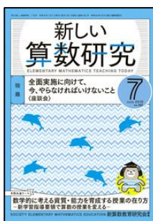
『新しい算数研究』(東洋館出版社)

特集1:見立てを変えれば、かわり変わる 特集2:「教育相談コーディネーター」の現在、これから<連載> ●いじめの被害と援助要請 ●不登校で共通する問題その1 睡眠時間のズレ <こら・む>ふだんと違うことのススメ ほか