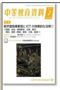
『中等教育資料』(学事出版)

総力大特集:大量退職・大量採用時代の教師教育の具体策を考える令和時代の若手教師育成 特集 O2:学力向上働き方改革を実現する小学校「教科担任制」をどう進めるか ●新時代のスキル継承●任せながら育てる!若手教師育成の5つのアイデア ほか