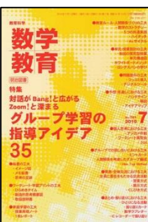
『教育科学/数学教育』(明治図書)

特集:全面実施に向けて、今、やらなければならないこと<座談会> ●授業をどう変えていけばいいのか> ●データから今を読む(傾向を読み取り未来を予想しよう) ●日常の事象に潜む算数(身近な日常事象の意味と情報の取捨選択) ほか