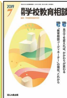
『月刊学校教育相談』(ほんの森出版)

特集:新学習指導要領とICTの効果的な活用①国語、社会、地理歴史、公民、数学、理科、芸術(音・美・工・書) ●なすことによって学ぶ~地域と繋がる生徒たち~ ●高等学校入学者選抜学力検査問題の工夫例[社会] ほか