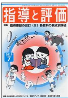
『指導と評価』(図書文化)

特集:超一流のワザに学ぶ!ペア・グループ学習アイデア大全 小特集:授業の腕を上げる!夏期集会&研究会情報 <連載> ●学力形成を支える国語教師のための「話し方」教室 ほか