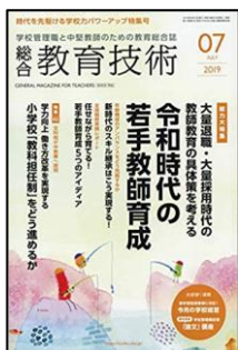
『総合教育技術』(小学館)

総力大特集:大量退職・大量採用時代の教師教育の具体策を考える令和時代の若手教師育成 特集 O2:学力向上働き方改革を実現する小学校「教科担任制」をどう進めるか ●新時代のスキル継承●任せながら育てる!若手教師育成の5つのアイデア ほか