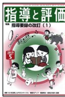
『指導と評価』（図書文化）

特集：永久保存版！国語教師のための定番教材の板書の技術 <連載>●変える国語授業—高大接続改革 ●子どもの心を動かす！国語授業10のエンジン ●学力形成を支える国語教師のための「話し方」教室ほか