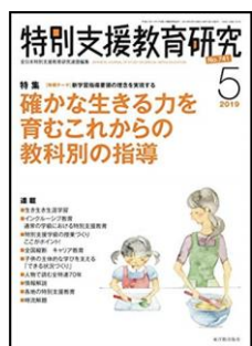
『特別支援教育研究』（東洋館出版社）

特集：指導要録の改訂（1） <連載>●QUを活用したPDCAサイクルで教育実践の向上をめざして ●教師力アップセミナー ●統説明文・意見文を書く指導 ●思考・判断・表現の評価と指導ほか