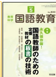
『教育科学 国語教育』（明治図書）

特集：実は殆どの生徒が理解できていない？重要学習事項のとおき指導アイデア ●自然数（数の集合） ●割合 ●速さ（道のり、時間） ●等式の性質・移項 ●比例式（yはxの関数である） ●反比例（双曲線） ●平行、回転、対称）移動一ほか