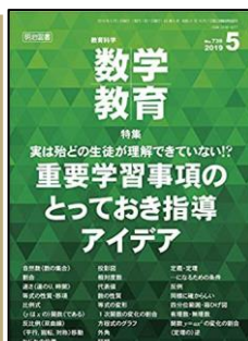
『教育科学/数学教育』（明治図書）

特集1：算数の授業を変えるために必要なこと ●総合的・発展的に考える授業への転換 ●授業のゴールは次への問い ●問題解決の型からの脱却 特集2：今、授業をいかに変えるか ●「数学的に考える資質。能力を育成する授業を考える」ほか