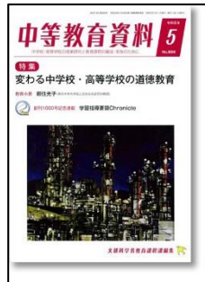
『中等教育資料』（図書文化）

総力大特集：新学習指導要領全面実施を見据えた移行期2年目の校内研修 特集2：新たな適応指導教室のあり方を考える 不登校生徒を学校に 特集3：キーパーソンはミドルリーダー！「全国学力調査」を生かした学校改革・授業改善PART2ほか