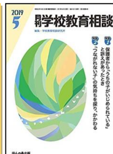
『月刊学校教育相談』（ほんの森出版）

特集：変わる中学校・高等学校の道徳教育 【論説】●中学校「特別の教科 道徳」の推進 ●高等学校における道徳教育推進<連載>●各教科等の改善 ●思考力等を問うほか