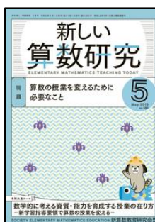
『新しい算数研究』（東洋館出版社）

特集1：保護者から「うちの子がいじめられている」と訴えがあったとき 特集2：「つながらない子」の気持ちを探り、かかわる <連載>●小学生との対話●事例でわかる！愛着障害ほか