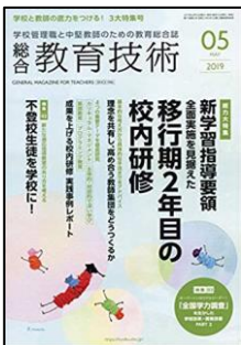
『総合教育技術』（小学館）

総力大特集：新学習指導要領全面実施を見据えた移行期2年目の校内研修 特集2：新たな適応指導教室のあり方を考える 不登校生徒を学校に 特集3：キーパーソンはミドルリーダー！「全国学力調査」を生かした学校改革・授業改善PART2ほか